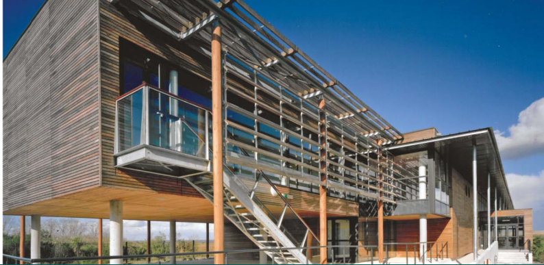
Lycée des métiers de la mer ©HPL Architectes ▲